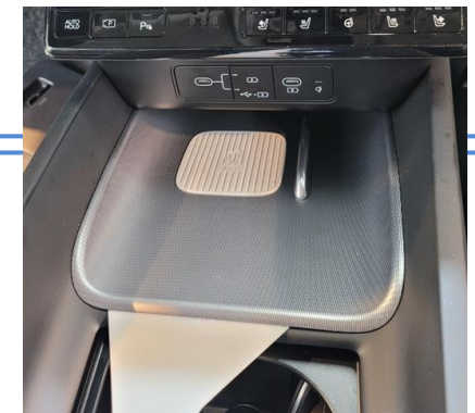
그랜저 GN7 탈거 순서